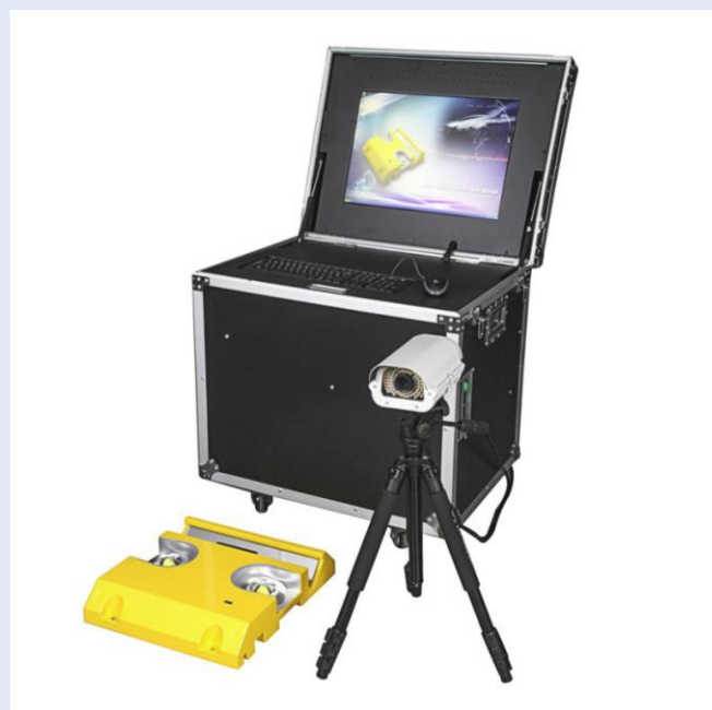
سیستم قابل حمل

شمائی از تجهیزات و قطعات مورد استفاده در سیستم کامل تصویربرداری زیر خودرو (سیستم ثابت)